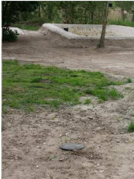
Fertiggestellte Pflanzenkläranlage für 30 Einwohnergleichwerte