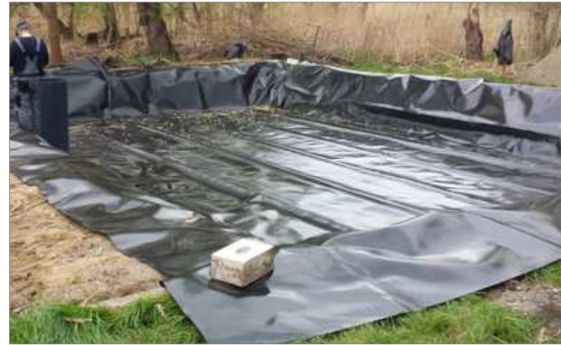
Horizontalfilter während der Bauphase